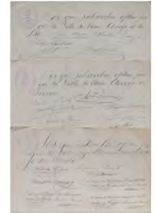
1937. Arroyo del Puerco. Consulta para la elección del nuevo nombre del municipio de Arroyo del Puerco. 6 hojas, [235 x 340 mm.], papel. Ayuntamiento de Arroyo de la Luz. ES.10211.AMUARL/01.01.13/00062/002