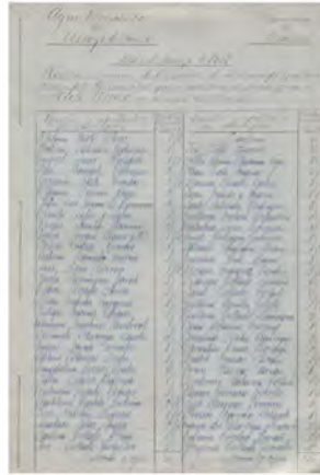
1937, marzo, 27. Arroyo del Puerco Relación nominal de los vecinos que han suscrito el Plato Único con indicación de la cantidad aportada. 5 hojas [230 x 340 mm], papel. Ayuntamiento de Arroyo de la Luz. ES.10211.AMUARL/02.07.04.06/00589/002