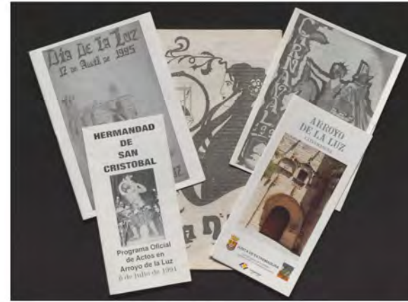
Arroyo de la Luz. Carteles, folletos y cuentas de ferias y fiestas. Ayuntamiento de Arroyo de la Luz. ES.10211.AMUARL/03.09.03.03/00592/003