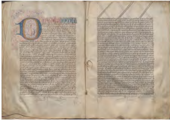
1494, enero, 16. Valladolid. Real ejecutoria copiada por petición de Arroyo del Puerco, en virtud de los autos seguidos contra villa de Cáceres. 114 hojas, [310 x 230 mm.], pergamino. Capitales miniadas. Ayuntamiento de Arroyo de la Luz. ES.10211.AMUARL/01.02.07.01/02505/002

El archivo municipal de Arroyo de la Luz fue organizado dentro del Programa de Organización de Archivos Municipales entre marzo y octubre de 2014. En este período se describieron 2509 unidades de instalación y se digitalizaron 71.313 imágenes. Muestra algunos de los documentos que destacan en el fondo documental, ya sea por su antigüedad o por reflejar actividades y momentos particulares de la vida municipal.